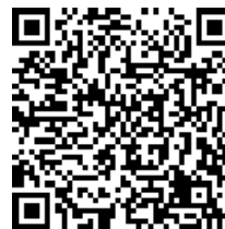
Página web del proyecto

La construcción está programada para comenzar en marzo de 2025 , la actividad, inicial incluirá la instalación de cercas alrededor de los Límites de Perturbación (LOD, por sus siglas en inglés), la instalación de las rutas de acceso a la construcción y las áreas de preparación. Los trabajos en el arroyo comenzarán en junio de 2025 y se espera que finalicen en junio de 2026 . La construcción se llevará a cabo en segmentos, las fechas previstas de construcción para cada segmento se actualizarán en el mapa del proyecto (reverso) que se publicará en la página web del proyecto.