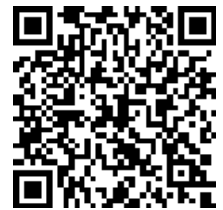
Cómo reducir las aguas pluviales