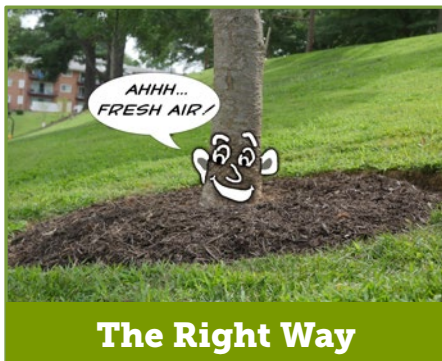
The Right Way

Applying mulch the wrong way can actually kill your trees!