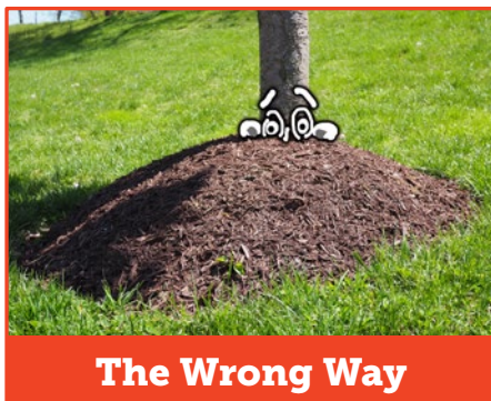
The Wrong Way