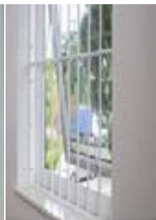
Rejas de Metal