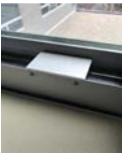
Bloque de Metal