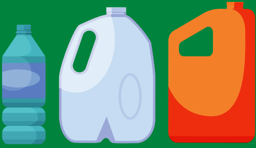
Plastic bottles Botellas de plástico