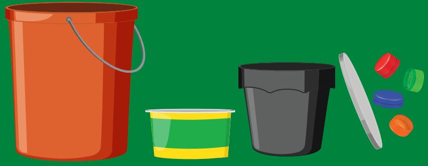
Plastic flower pots, buckets, jars, containers, caps & lids Macetas de plástico, cubos, frascos, recipientes y tapas