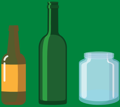
Glass bottles & jars Botellas y envases de vidrio