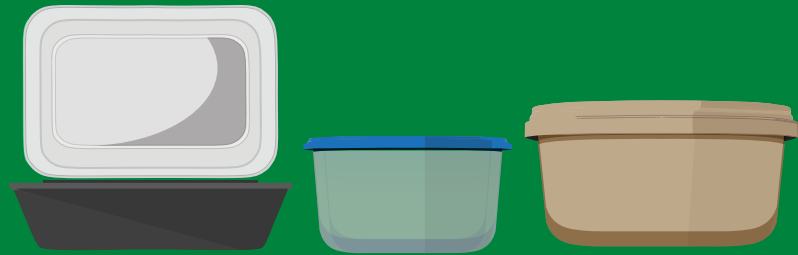
Plastic durable reusable containers & lids, & #1 PET containers & packaging Contenedores y tapas reutilizables durables de plástico y envases, y empaques de PET #1