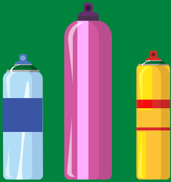
Empty, non-hazardous aerosol cans Latas de aerosol vacías no peligrosas