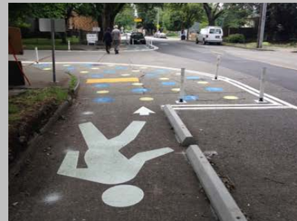
Arriba: tope Segundo de Arriba a Abajo: banqueta temporal Tercero de Arriba a Abajo: mini glorieta Abajo: carril peatonal

Para inscribirse en la lista de correo de actualización del proyecto, envíe un correo electrónico a Matt.Johnson@MontgomeryCountyMD.gov e indique que está interesado en la lista de correo del proyecto de Fenton Village.